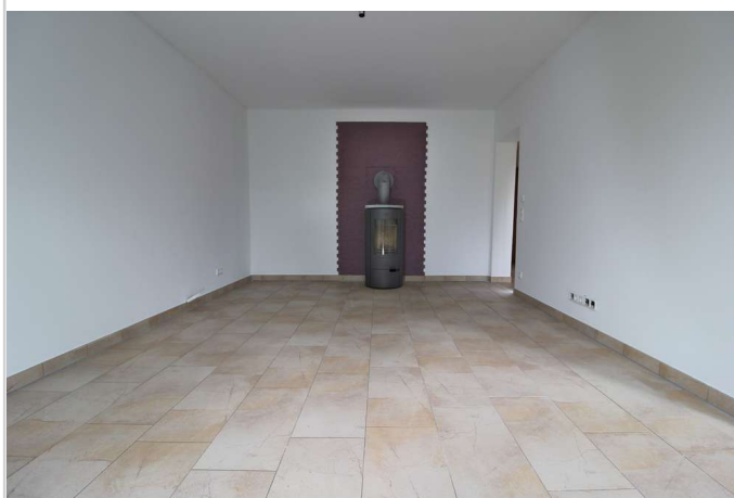
EG Wohnzimmer mit Kamin