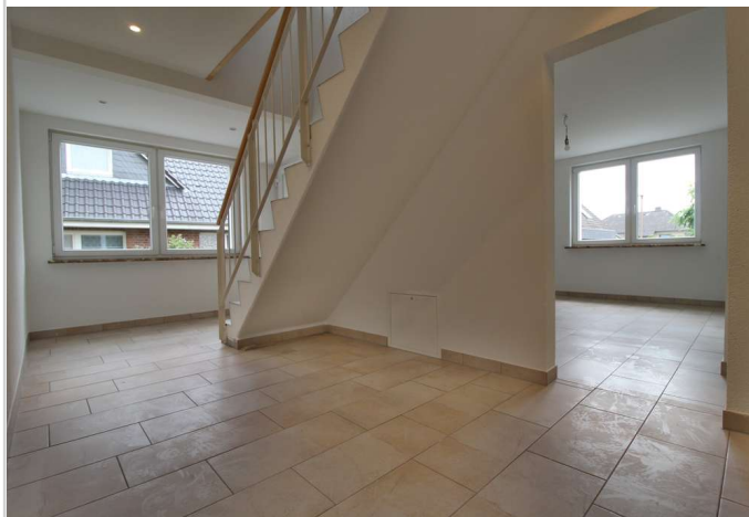
EG Flur zum Esszimmer