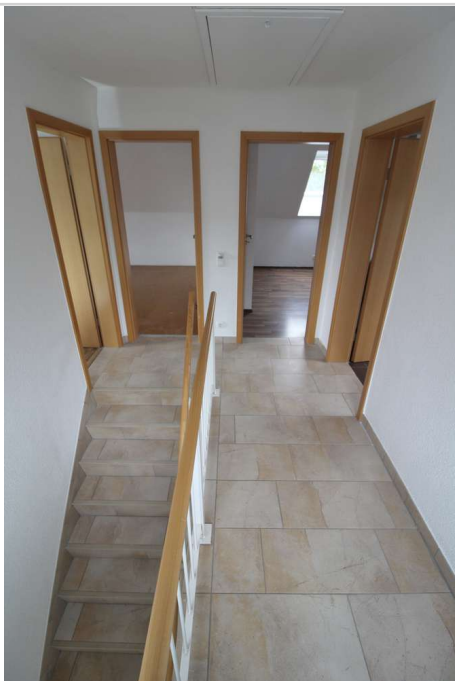
OG Flur Richtung Schlafzimmer