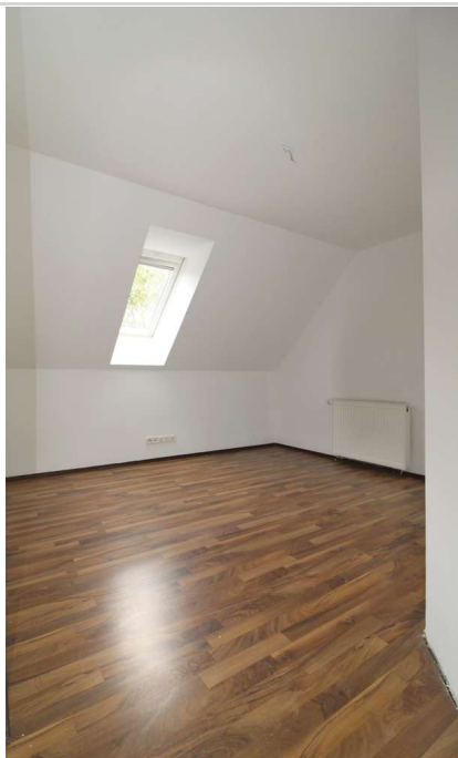
OG Schlafzimmer 1

Zimmer: 6,00 Wohnfläche ca.: 144,00 m 2 Kaufpreis: 385.000,00 EUR