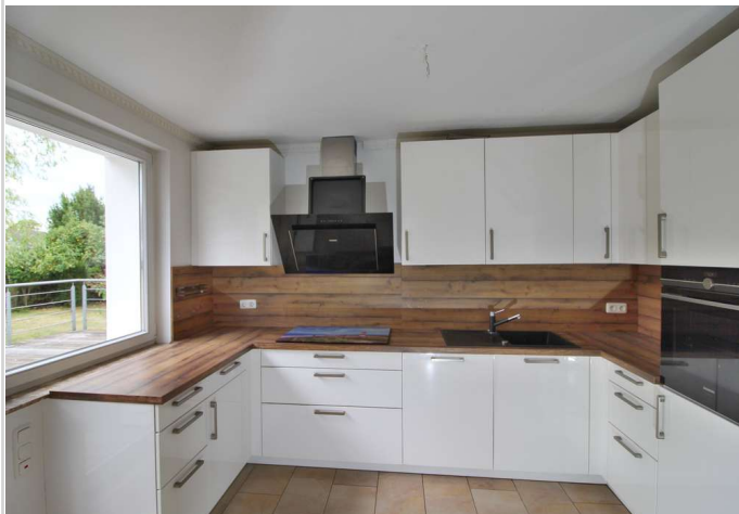
EG Küche rechte Seite

Zimmer: 6,00 Wohnfläche ca.: 144,00 m 2 Kaufpreis: 385.000,00 EUR