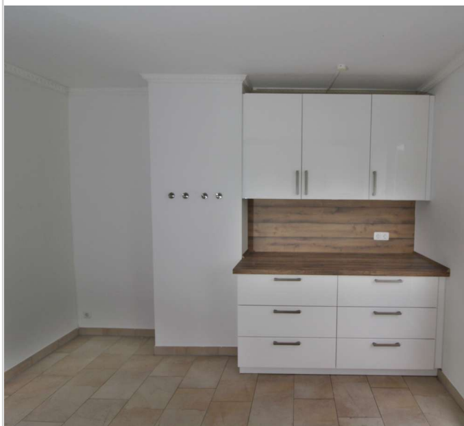
EG Küche linke Seite