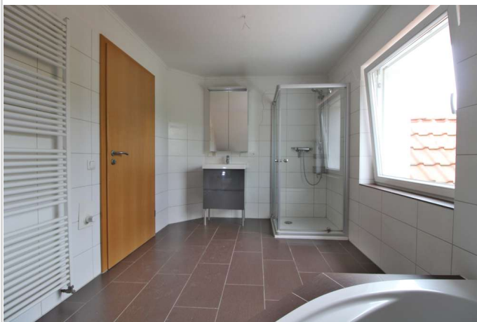
OG Bad Richtung Dusche