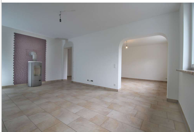
EG Wohnzimmer Richtung Esszimm