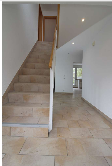
EG Flur Richtung OG