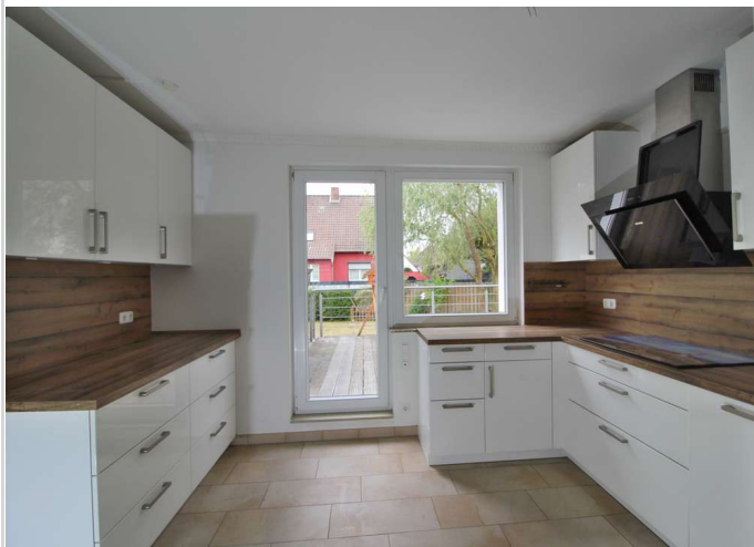
EG Küche Richtung Terrasse