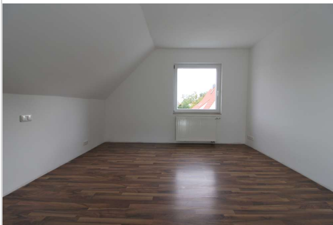
OG Schlafzimmer 2