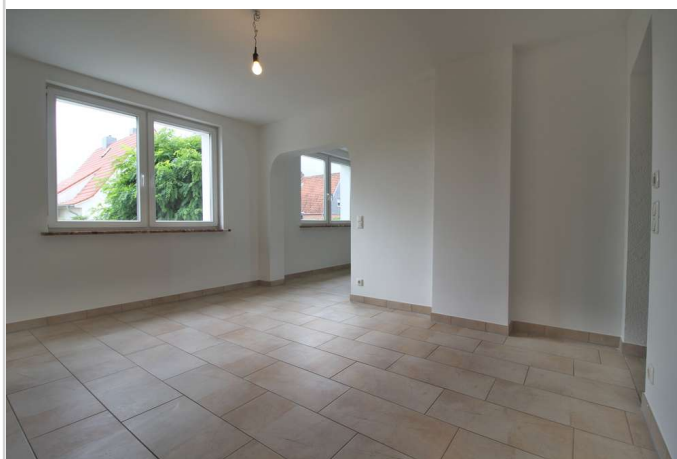
EG Esszimmer Richtung Wohnzimm