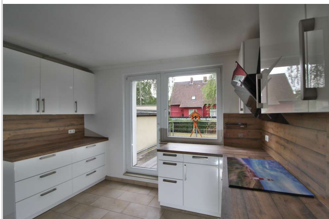
EG Küche zur Gartenterrasse