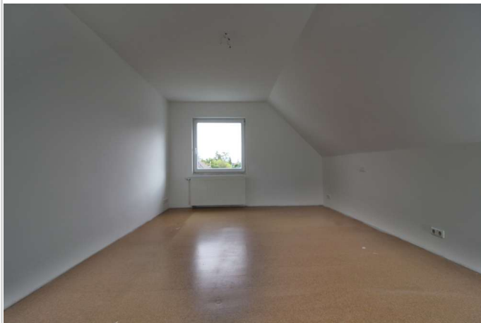
OG Schlafzimmer 3