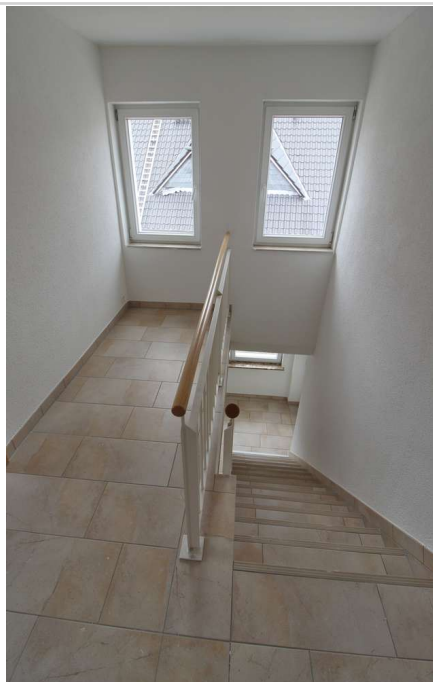
OG Flur Richtung EG