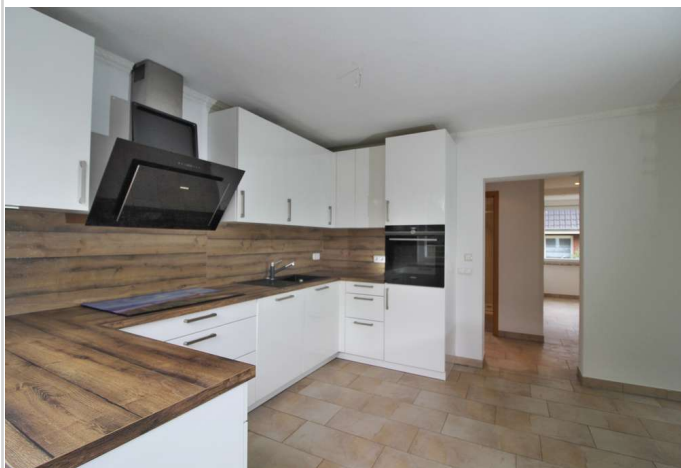
EG Küche Richtung Flur