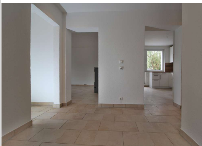
EG Flur Richtung Wohnzimmer