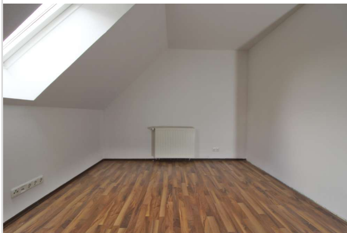
OG Schlafzimmer 1