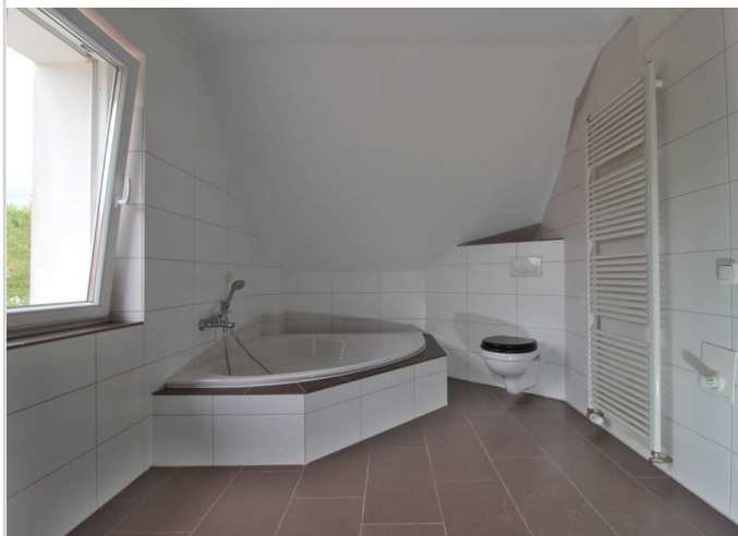
OG Bad Richtung Wanne