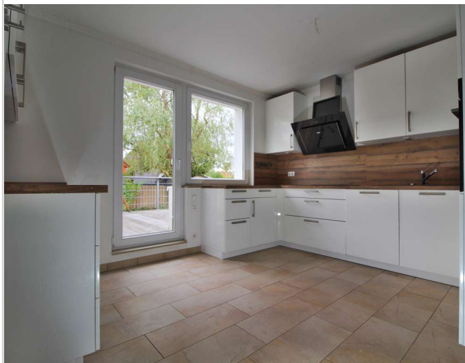
EG Küche Richtung Terrasse