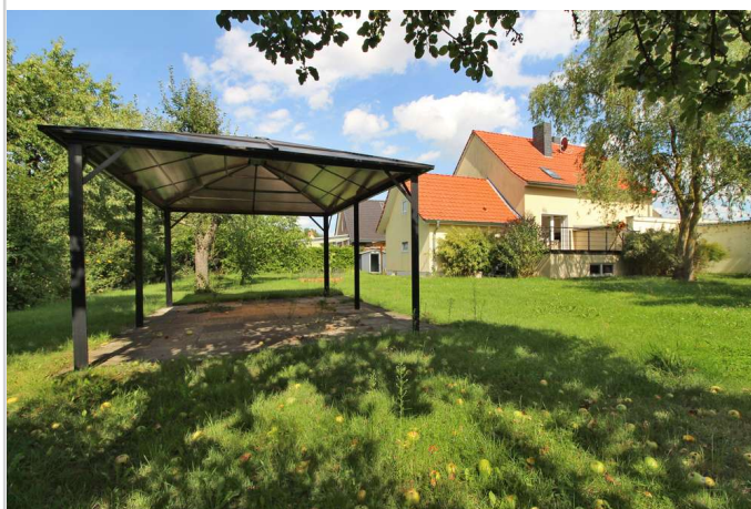
Garten mit Freisitz