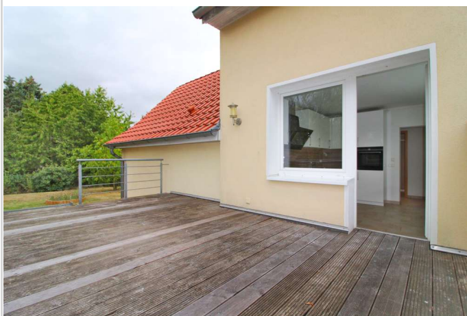
EG Gartenterrasse Richtung Küc

Zimmer: 6,00 Wohnfläche ca.: 144,00 m 2 Kaufpreis: 385.000,00 EUR